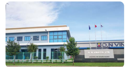
Công ty TNHH O.N Vina O.N Vina Co., Ltd