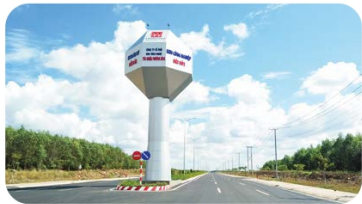
Cổng chào Welcome Gate