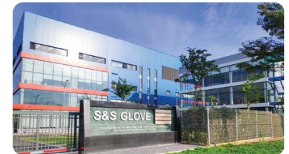
Công ty S&S Glove S&S Glove Corporation