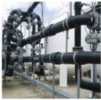
Hệ thống cấp nước: Đạt tiêu chuẩn TCXDVN 33.2006 với công suất 3.000m 3 /ngày đêm