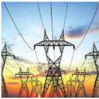
Hệ thống lưới điện quốc gia: Đạt tiêu chuẩn 11TCVN18:2006 với điện áp 22KV