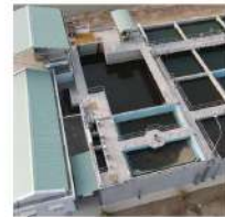
Nhà máy xử lý nước thải Công suất hoạt động 1.845m 3 ngày/đêm