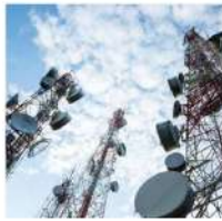
Hệ thống thông tin liên lạc: Đảm bảo thông suốt đầu nối với các khu vực chức năng trong CCN