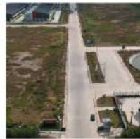
Đường giao thông nội bộ: bề tổng xi măng thiết kế theo tiêu chuẩn VNH18-H30 BXD gồm 3 tuyến đường: Đường số 1: lộ giới 24.5m Đường số 2: lộ giới 21m Đường số 3: lộ giới 21m.