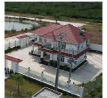
Trung tâm dịch vụ công nghiệp TICCO luôn sẵn sàng hỗ trợ các nhà đầu tư