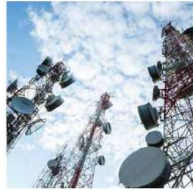
Hệ thống thông tin liên lạc

CHỦ ĐẦU TƯ: CÔNG TY CỔ PHẦN ĐẦU TƯ VÀ XÂY DỰNG TIỀN GIANG