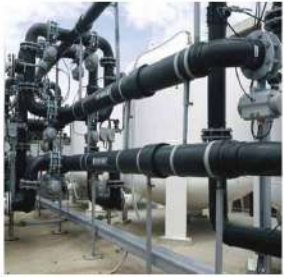
Hệ thống cấp nước với công suất 3.000 m 3 ngày/đêm