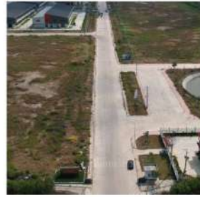
Đường giao thông nội bộ