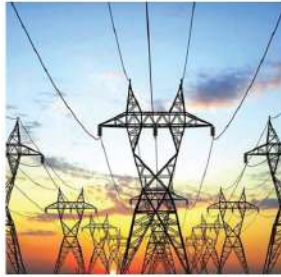
Hệ thống lưới điện quốc gia