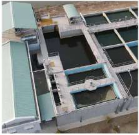
Nhà máy xử lý nước thải