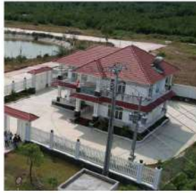
Trung tâm dịch vụ công nghiệp TICCO