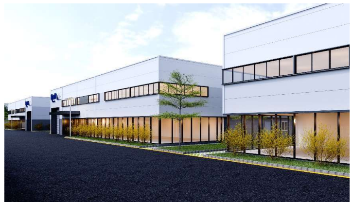
(Hình ảnh thiết kế 3D dự án/ Design 3D' pictures)