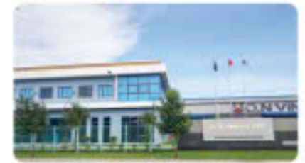
Công ty TNHH O.N Vina O.N Vina Co., Ltd