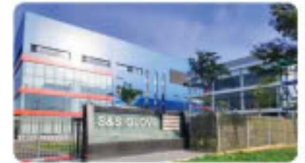
Công ty S&S Glove S&S Glove Corporation