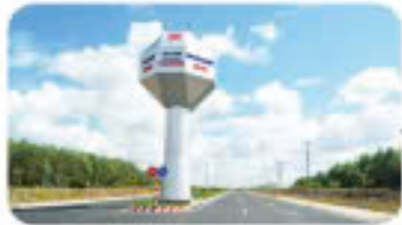
Cổng chào Welcome Gate