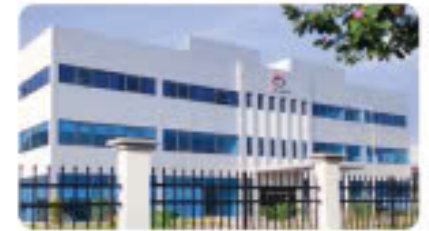
Công ty Con-well Con-well Metal Vietnam Co., Ltd