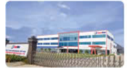
Công ty Guardian Guardianmade Vietnam Co., Ltd