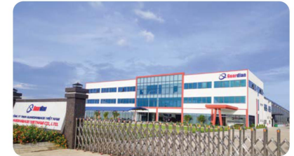
Công ty Guardian Guardianmade Vietnam Co., Ltd