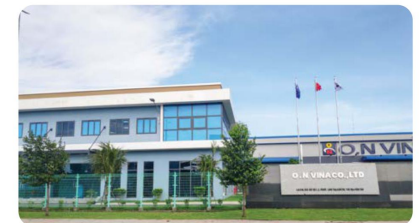
Công ty TNHH O.N Vina O.N Vina Co., Ltd