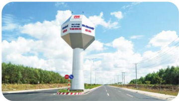
Cổng chào Welcome Gate