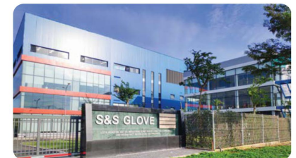
Công ty S&S Glove S&S Glove Corporation