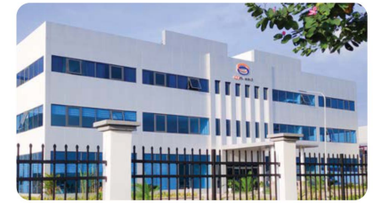
Công ty Con-well Con-well Metal Vietnam Co., Ltd